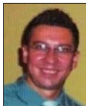
Fassel D. st.