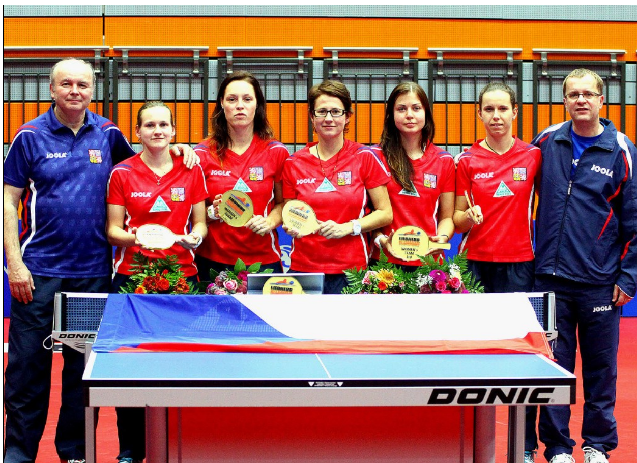
Zatím poslední česká medaile z mistrovství Evropy – bronzové družstvo žen na ME 2013 ve Schwechartu