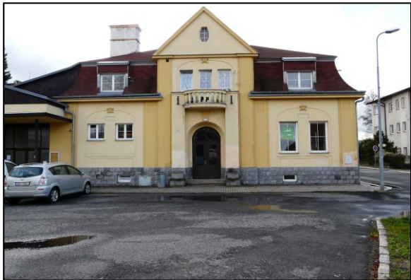
Svatava ČSA 247