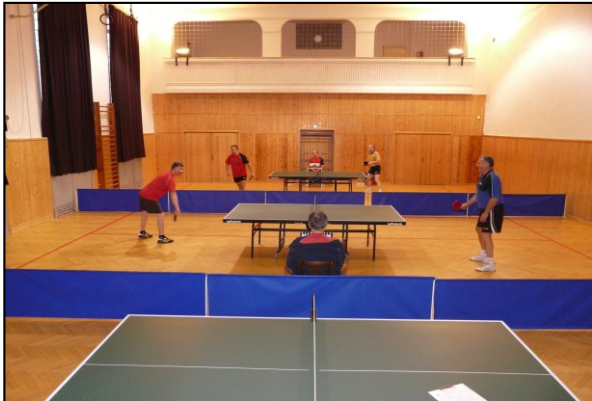
Tělocvična TJ Baník Svatava