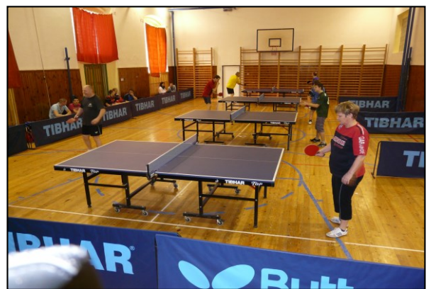
Tělocvična 2.ZŠ Sokolov