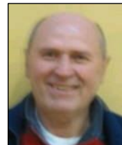
Hofman J. st.