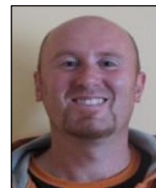
Hofman J. ml.